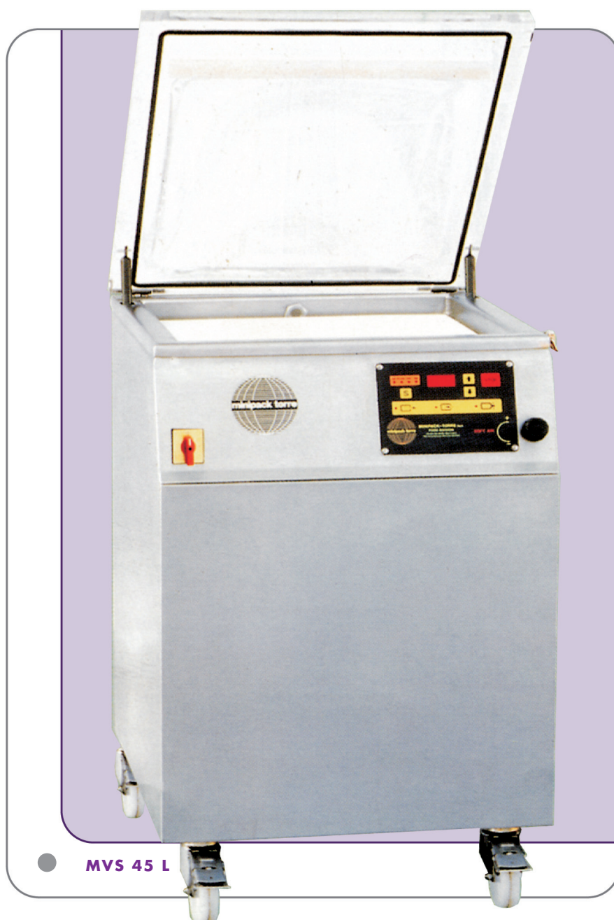
● MVS 45 L